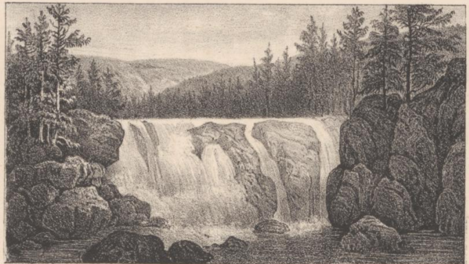
Elbfälle im Elbgrunde.