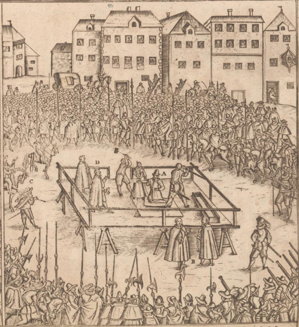
ABRIS DES VRTHEIS VND EXECVTION MIT DEM GRAVEN VON HARDECK ERGANGEN GESCHEHEN DEN 15. IUNI ANNO 1595.