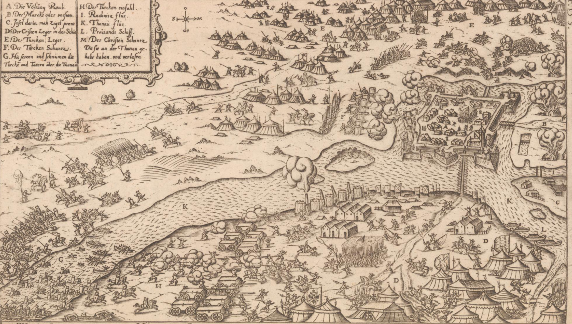
WAHRE CONTRAFACVVR DER VÖESTVNG RAAB IN VNGERN. WIE DIE VOM TVRCKEN BELEGERT GEWEST. IM 1594. IAHR.